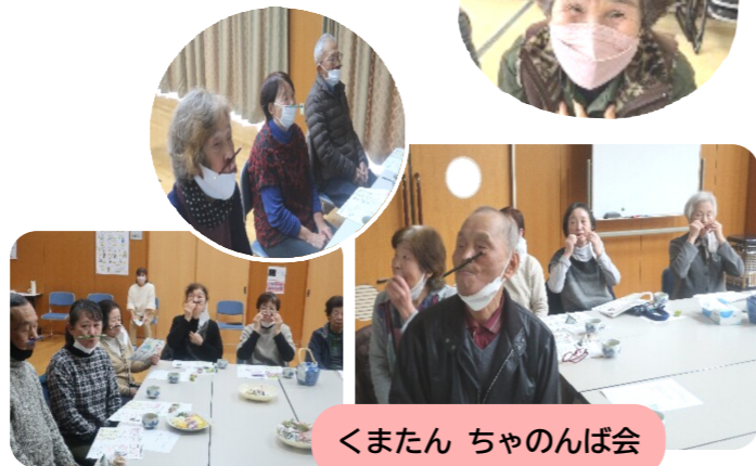
くまたん ちゃのんば会